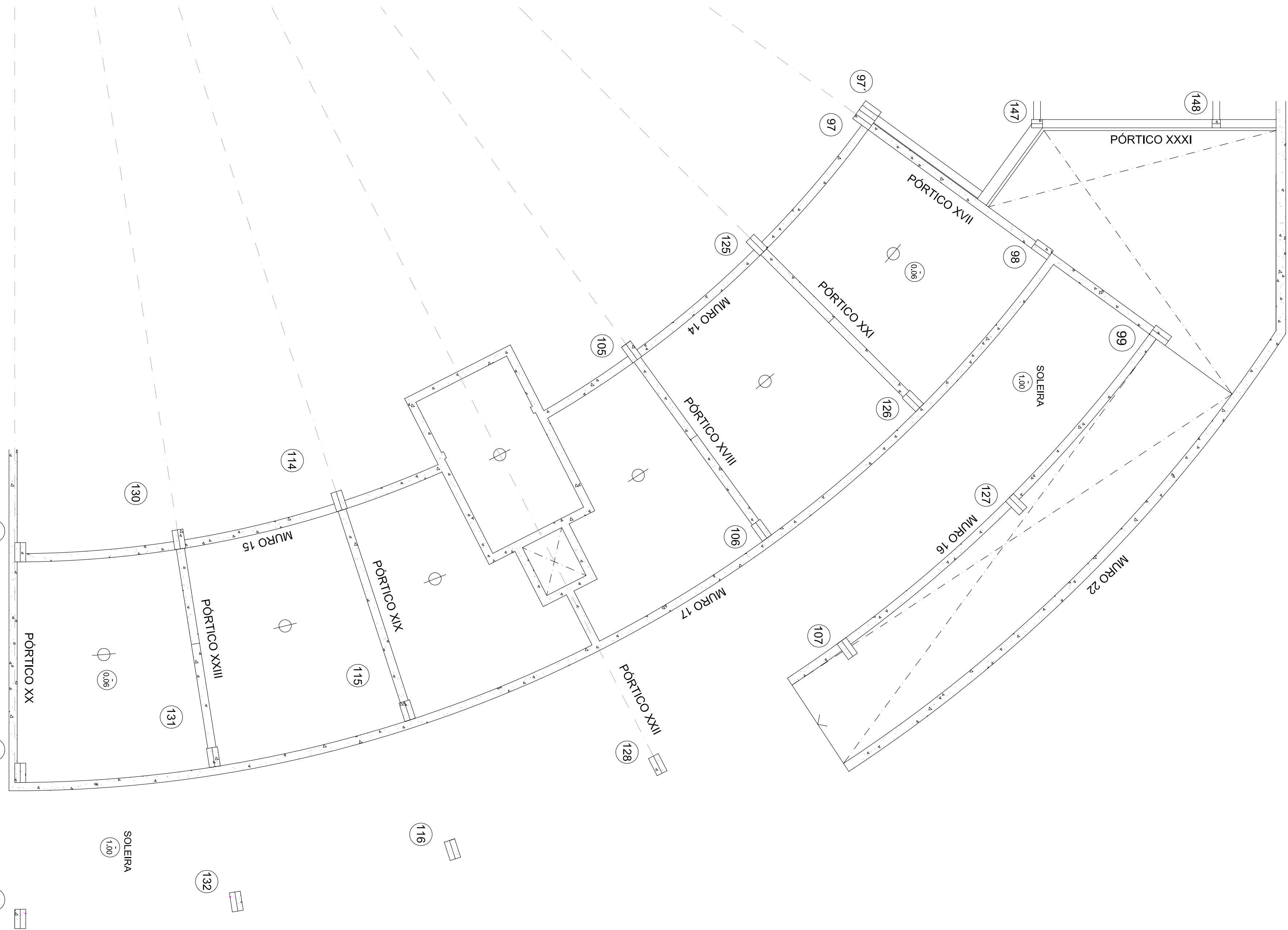
PLANTA DE FORXADOS EN COTA -0.06 1:100